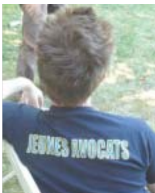
Romain Carayol, Président de la Fédération Nationale des Unions de Jeunes Avocats (FNUJA)