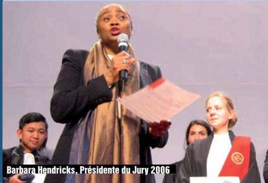
Barbara Hendricks, Présidente du Jury 2006